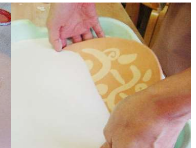
釉薬を掛ける。裏をスポンジで拭き本焼へ。