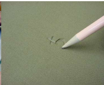
いったんひっくり返して裏にサインする。