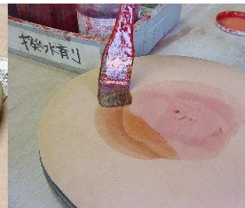
素焼後、裏に撥水剤をぬる。