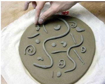
本体の粘土の上に置く。あまり端に置かないようにする。