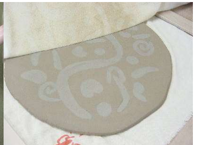
表にして布をはずす。