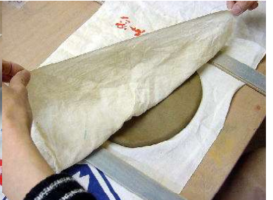
タタラ板7 mm を左右にセットし、上にも布を置く。