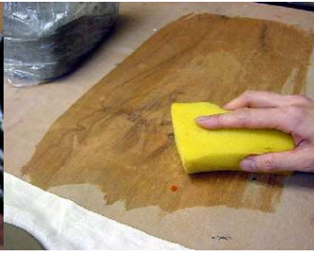
机を湿らせておく。