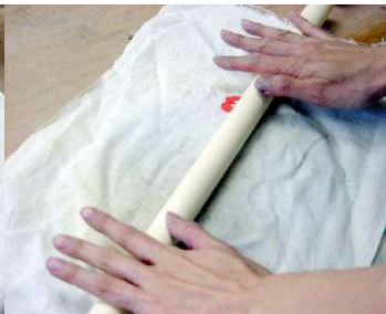
もう一度タタラ板7 mm をセットし、ローラーでのす。