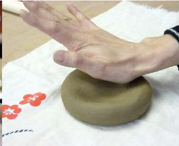
布の上に置き、たたいて平たくする。