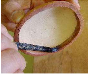
ふたの内側にもぬる。