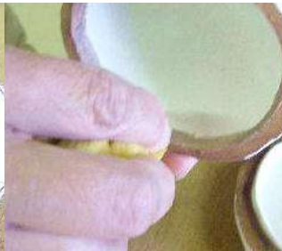
アルミナ入り撥水剤をぬったところもスポンジで拭く。