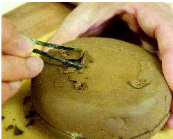
安定するよう裏を削る。