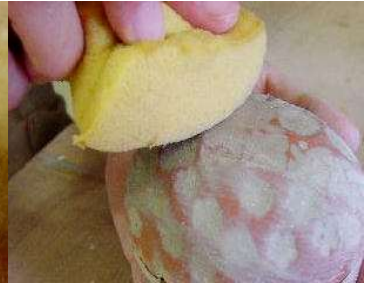
スポンジで軽く拭き取る。