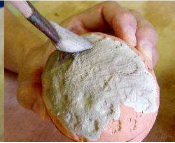
白化粧 No.2 を筆でぬる。