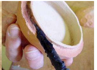
素焼後、ふたと本体が接触する部分にアルミナ入り撥水剤をぬる。