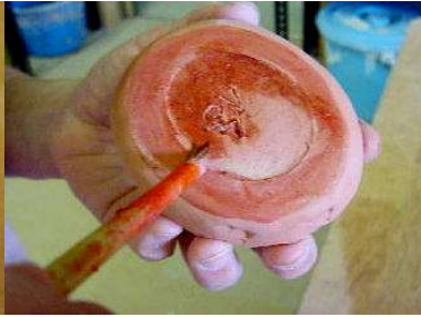
高台は普通の撥水剤をぬる。