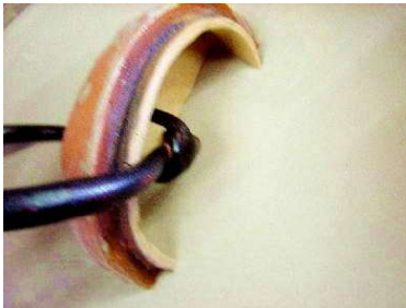
本体に土灰釉を掛ける。ふたも同様に。