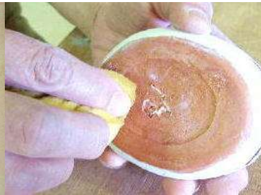
高台をスポンジで拭く。