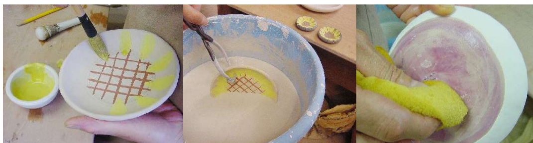
塗ったところを触って汚さないように注意。 透明釉を掛ける。 裏をスポンジで拭き本焼へ。