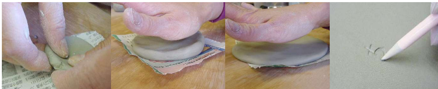
縁を持ち上げる。 小皿も同様にたたいて平たくし、裏にサインをする。