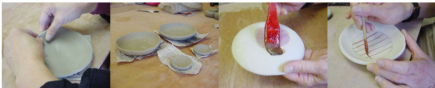
縁を持ち上げる。 成形完成。乾燥後、素焼。 素焼後、裏に撥水剤をぬる。 下絵具で箸置と小皿に絵付をする。