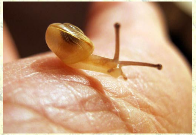
額紫陽花についてきた、近所の庭に放つ