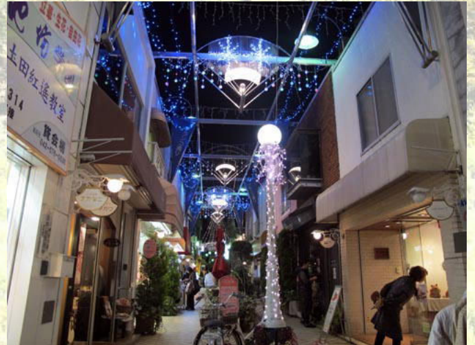
ブランコ通りの11月