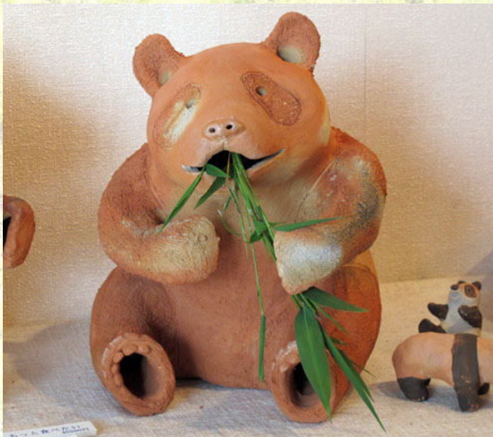
いつもいつも竹ばかり