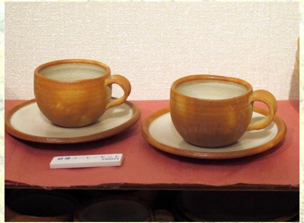
緋襷コーヒーセット