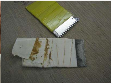
たたきながら丸め、だいたいのかたちにする。目と羽の位置決め。ノコギリ刃道具。