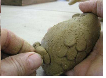
くちばしを付ける。鼻の穴を忘れずに。 足を付ける、指は前後2本ずつ、計4本。