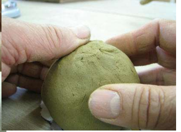
野焼土400g 丸める。 玉作りから口をつぼめ閉じ、空気を中に封じる。 風船作り。