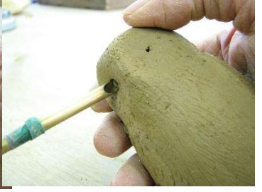
接着の水を付ける。粘土の小さな玉をなすり付け、羽を作る。 ポンスで目を開ける。