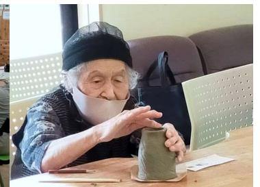
ニューオキライ。 カリタス大船渡。 キャッセン大船渡。 ホットハウス。