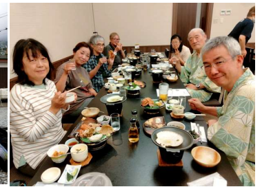
朝6時出発。 三陸道全通で時間が取れて一本松へ。ふれあい地蔵尊に。 憧れの大船渡温泉宿泊。