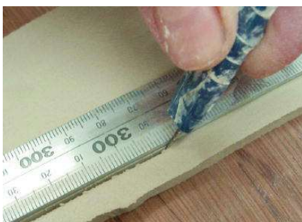
タタラで作った粘土板を針で切り、丸める ポップな形