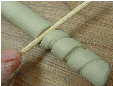
串でらせん文様を付ける、板にはさんで平たくし、曲げる