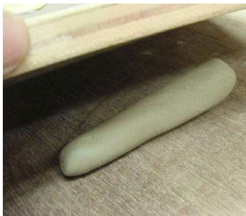
棒状に丸めて、板にはさんで平たくし、曲げる