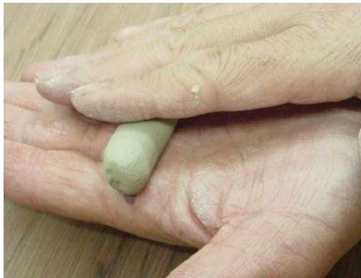
棒状に丸めて、平たくして、曲げる